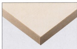
TP-190T TOP / TJY 2080K