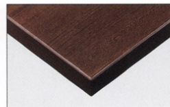
TP-191K TOP / TJ-2031KQ98