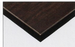
TP-191D TOP / TJ-301KQ98