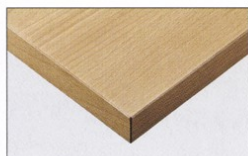
TP-190C TOP / JC-2016K