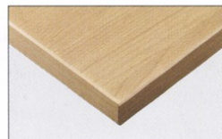
TP-191C TOP / JC-2016K