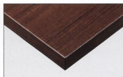
TP-190K TOP / TJ-2031KQ98