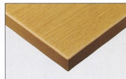
TP-191N TOP / AY-1021KG