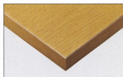
TP-190N TOP / AY-1021KG