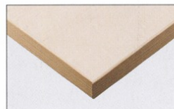
TP-191T TOP / TJY 2080K