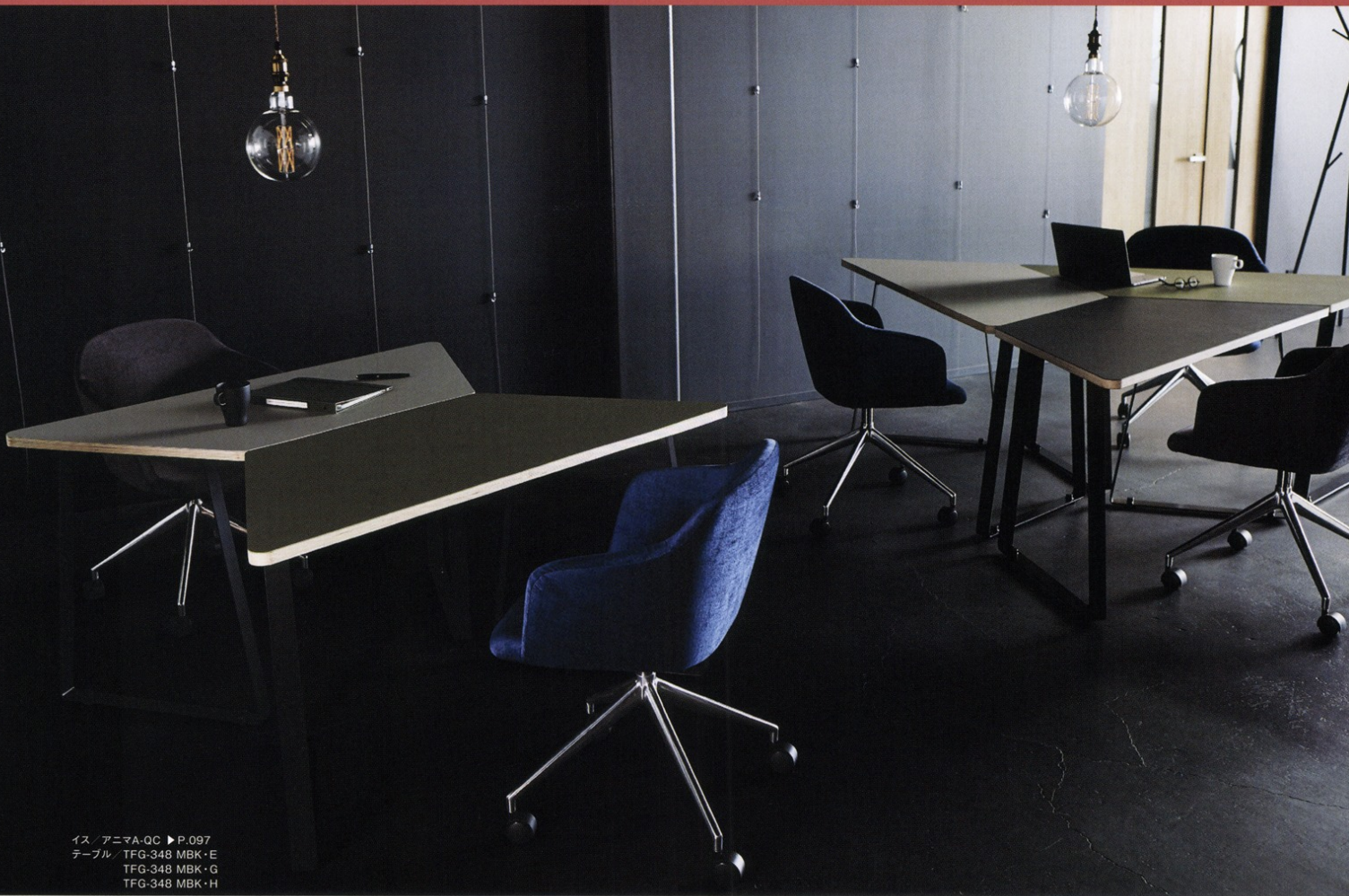
イス / アニマA-QC ▶ P.097 テーブル / TFG-348 MBK・E TFG-348 MBK・G TFG-348 MBK・H