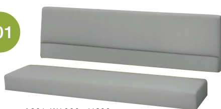
ベンチ201 W1000・H600 張地 / レザー・プレザント PL-13 ㊦