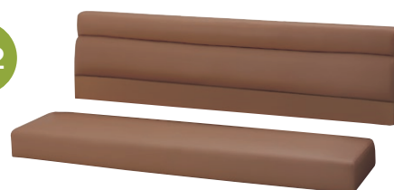
ベンチ202 W1000・H600 張地 / レザー・プレザント PL-16 ㊦