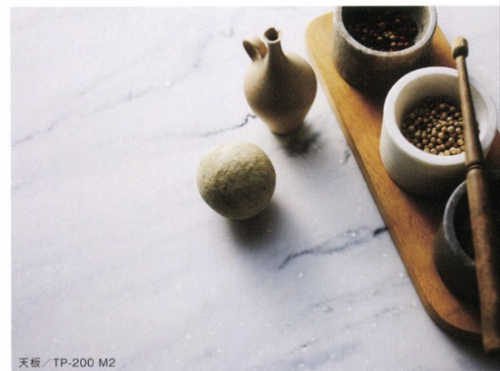
天板 / TP-200 M2

天板の中に芯材が入っている のでビスで固定ができます。 必ず下穴を開けてからビス で固定してください。