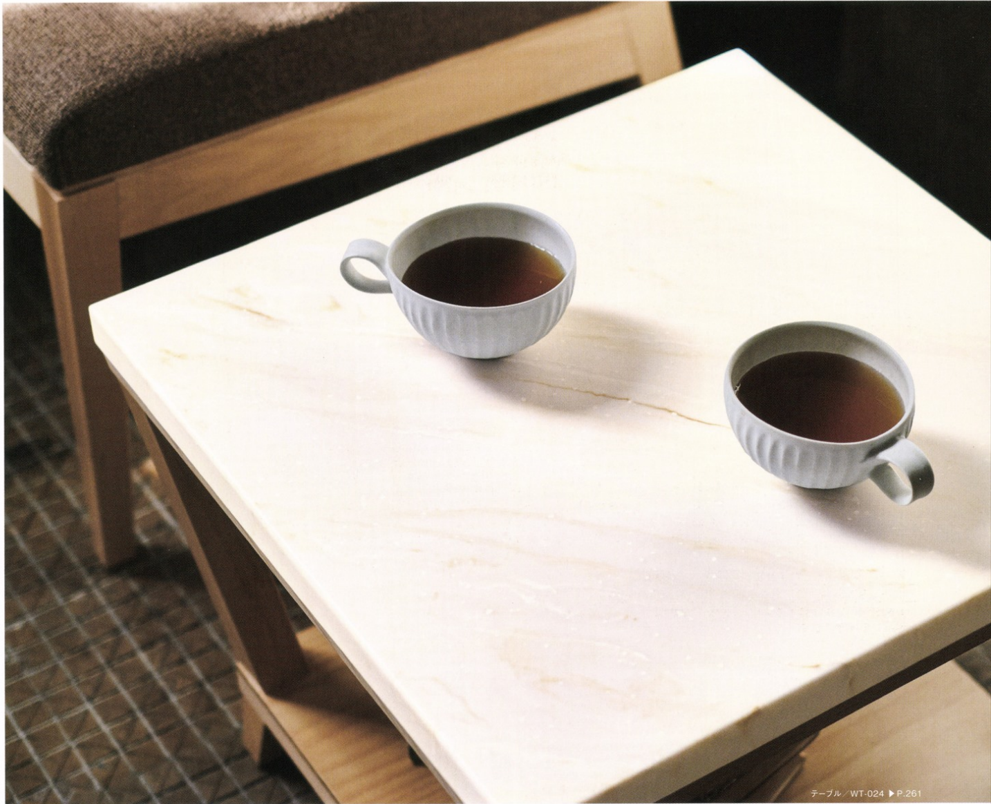
テーブル / WT-024 ▶ P.261